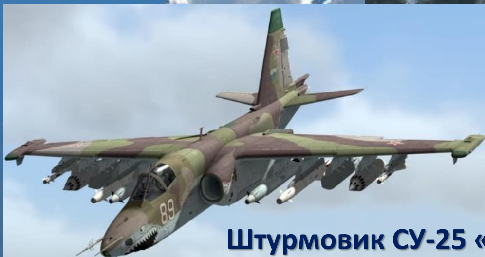
Штурмовик СУ-25 «Грач»